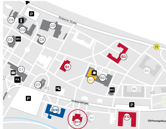
Lage der Station B11 im Krankenhausgelände

Unser Krankenhaus liegt rund 20 km von der Landeshauptstadt Dresden entfernt und ist mit der Regionalbahn von Dresden, Kamenz, Bautzen, Görlitz und Zittau aus gut erreichbar, mit dem Auto über die Bundesstraße B6 oder über die Autobahn A4, Ausfahrt Ottendorf-Okrilla/Radeberg.